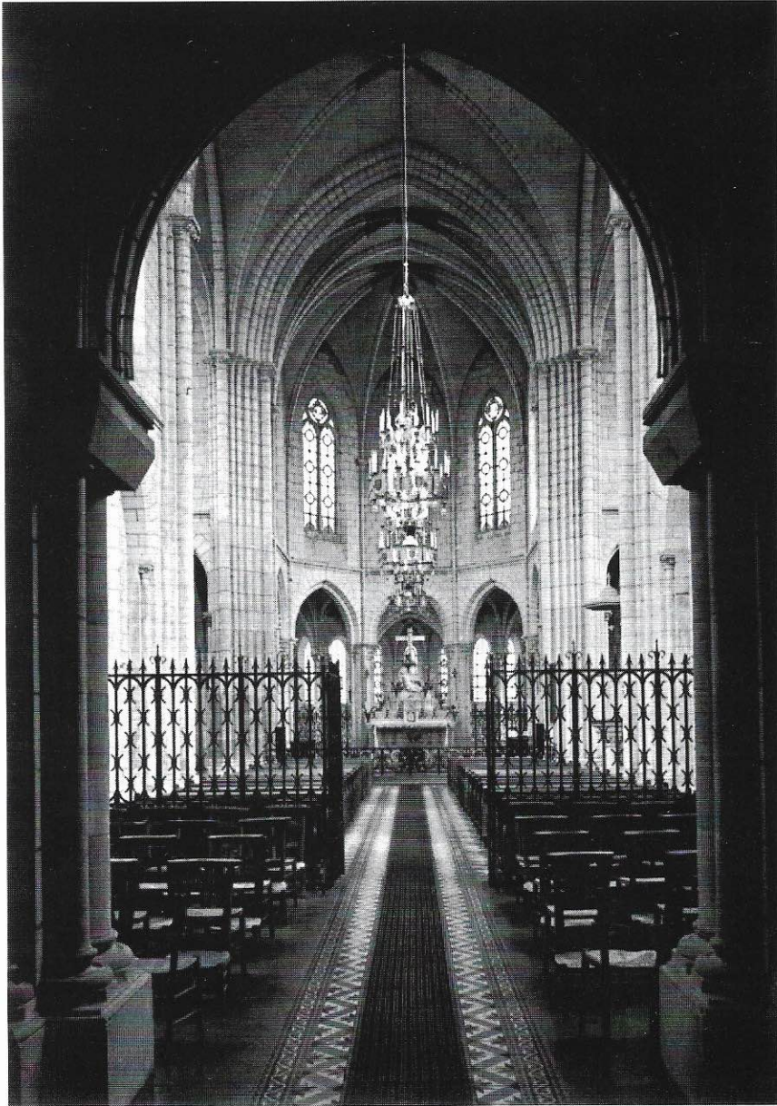
La chapelle du petit séminaire de Précigné.